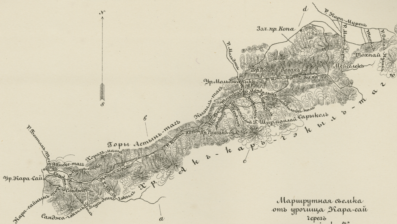
Маршрутная съёмка отъ урочища Кара-сай черезъ золотые прииски Кона до урочища Далай-Кугань