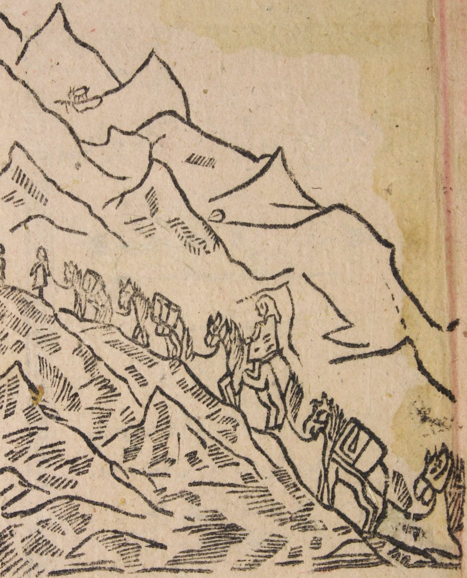
کاشغر گزیده اداره پسته پستلیدی